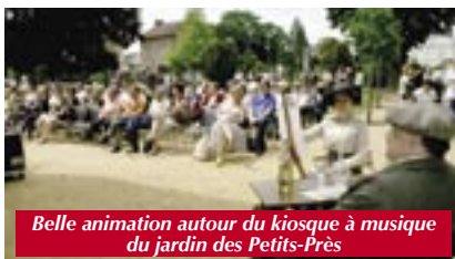
Belle animation autour du kiosque à musique du jardin des Petits-Près

Ainsi que nous l'avions annoncé (Autant n°226), le dimanche 13 juin à travers son programme particulièrement riche en rendez-vous a marqué en quelque sorte le coup d'envoi des animations estivales dans la cité des fables en préambule à la Fête de la Musique, à la Fête à Jean et aux festivités du 14 juillet. Une journée dominicale à laquelle s'était invité un temps radieux et qui démarra dès potron minet par une brocante déployée place de l'Hôtel-de-