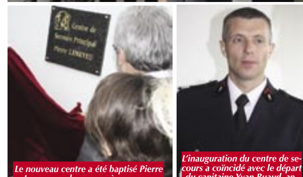
Le nouveau centre a été baptisé Pierre Leneveu en hommage à ce sapeur pompier décédé en intervention