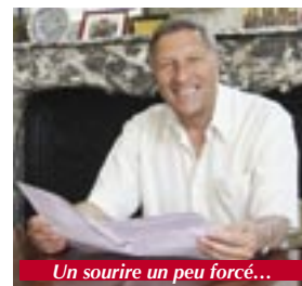
Un sourire un peu forcé...

Au passage, je voulais aussi lui poser quelques questions sur les légitimes interrogations du moment : le départ plus que probable de son adjoint