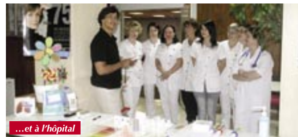
...et à l'hôpital

Pour aller plus encore au devant du public, l'équipe médicale avait dressé un stand d'information, le vendredi précédent, sur le marché au pied de l'hôtel-de-ville, où les passants étaient invités à