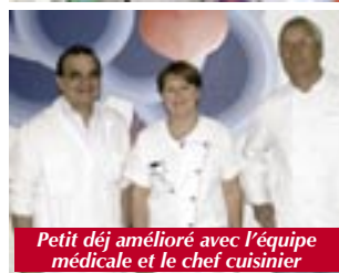
Petit déj amélioré avec l'équipe médicale et le chef cuisinier

Pour aller plus encore au devant du public, l'équipe médicale avait dressé un stand d'information, le vendredi précédent, sur le marché au pied de l'hôtel-de-ville, où les passants étaient invités à